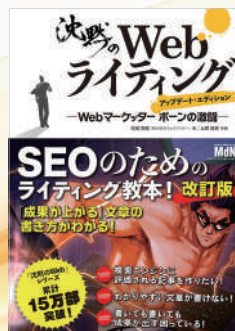
沈黙のWebライティング